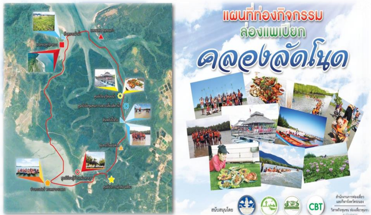
รูปแบบและเส้นทางการท่องเที่ยว

2. การท่องเที่ยวเกาะแก่งบริเวณชายฝั่งและหมู่เกาะนอกชายฝั่ง การท่องเที่ยวรูปแบบนี้พัฒนาขึ้นสำหรับนักท่องเที่ยวที่ต้องการไปเที่ยวยังแหล่งท่องเที่ยวอดนียม เช่น เกาะกำนอก เกาะกำใน เกาะพยาม และหมู่เกาะระนองอื่น ๆ