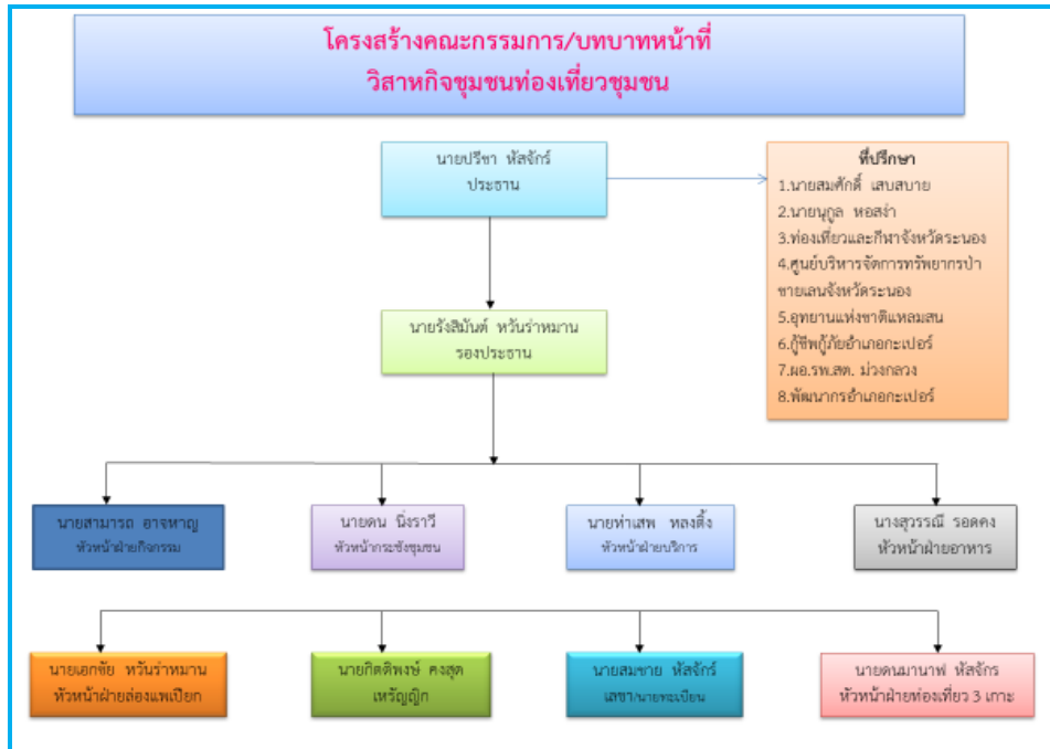
โครงสร้างคณะกรรมการ