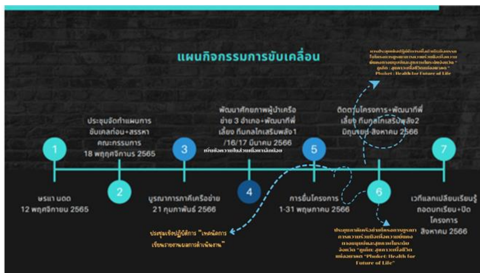
ภาพประกอบที่ 4 การปรับเปลี่ยนแผนกิจกรรมการขับเคลื่อนโครงการฯ

จากการดำเนินกิจกรรมตั้งแต่พฤศจิกายนจนถึงปัจจุบัน พบว่า คณะอนุกรรมการได้มีขับเคลื่อนงานตามแผนงานที่วางไว้ และมีการวิเคราะห์สถานการณ์ จัดระเบียบข้อมูลร่วมกัน มีโดยใช้การสื่อสารในแนวราบ จากความสัมพันธ์ส่วนตัวเป็นตัวเชื่อมประสาน จนเกิดความเข้าใจร่วมกันในการ มีการปรับเปลี่ยนแผนการทำงาน โดยเพิ่ม 3 กิจกรรมในแผนปฏิบัติการ ในช่วงเดือนมิถุนายน เพื่อแก้ปัญหาคือการสื่อสารในองค์กร ได้แก่ การจัดประชุมเชิงปฏิบัติงานการเขียนรายงานผล และจัดการประชุมกับภาคีเครือข่าย 2 ครั้ง ทำให้ได้ช่องทางการสื่อสารกับภาคีเครือข่ายในการทำงาน แสดงดังภาพประกอบที่ 4