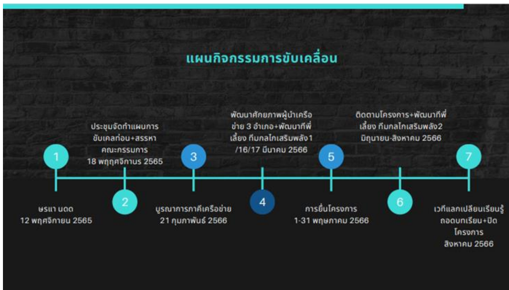
ภาพประกอบที่ 3 แผนกิจกรรมการขับเคลื่อนโครงการฯ

กรรมการฯ ได้สร้างช่องทางการสื่อสารเพื่อติดต่อกับภาคีเครือข่าย รวมทั้งการพัฒนาศักยภาพภาคีเครือข่าย โดยมีกลุ่มเป้าหมายคือทีมพี่เลี้ยงผู้จัดทำโครงการ ทีมกลไกเสริมพลัง แสดงดังภาพประกอบที่ 3