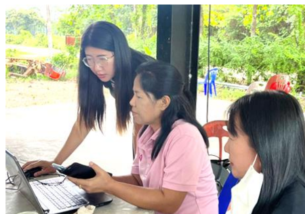
แต่ละพื้นที่เขียนแผนงานผ่านระบบเว็บไซต์ โดยมีทีมพี่เลี้ยงร่วมแลกเปลี่ยนและเสนอแนะ