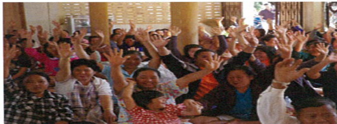
กิจกรรม ประชุมชี้แจงโครงการ 5 เม.ย. 55 ณ ศาลาวัดบ้านห้วยข้าวกล้า